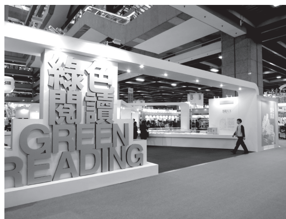
本館「悠遊天下一明代文人的樂活方式」古籍文獻展

本屆臺北國際書展共計有60個國家參與，749家出版社，計2,183個攤位參與這場亞洲最盛大的